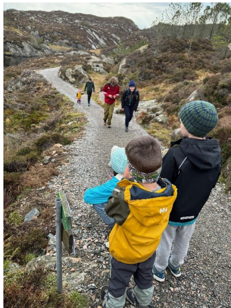
Deltakarar ute i turløypa